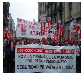
El S.T.S-C siempre a la cabeza de cualquier lucha sindical

•La patronal añade que, si finalmente Interior acepta sus propuestas, muchos inmigrantes querrian trabajar, “ son puestos atractivos para los extranjeros, pues aunque trabajen fines de semana el sueldo asciende a “1200€”, horas extras aparte ” INCREBLE PERO CIERTO.