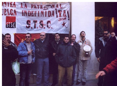
Concentración del S.T.S. En las puertas de APROSER en Madrid, Catalunya y Andalucía juntas por el S.T.S.