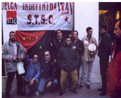
S.T.S-C Y S.T.S-A, JUNTOS EN LA MOVILIZACION DE MADRID, CONTRA LA FIRMA DEL CONVENIO

¿No tienen bastante con sus suculentas subvenciones por parte de los empresario y el Gobierno... ? ¡¡BASTA YA!! (pagina 2)